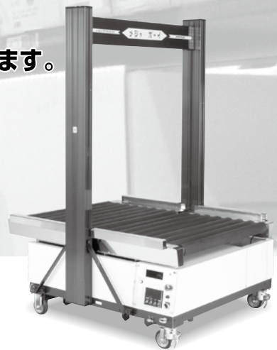
搬送型重量計測機 メジャーボーイ MB-900シリーズ