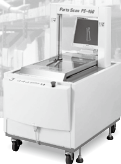
小物用重量計測機 パーツスキャン PS-450

複雑な形状物や多様な商品の寸法・重量を 効率良く測定したい! —— そんなご要望にお応えして、 正確・簡単・迅速な商品マスタの計測を実現します。